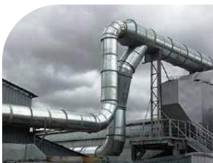
Sistemas de exaustão