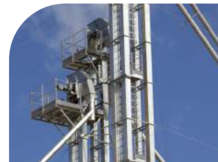
Elevadores de caneca