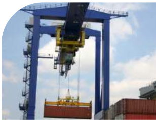
Indústria e Comércio