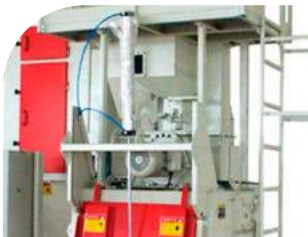
Equipamento de jateamento