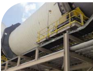
Resfriadores de minério