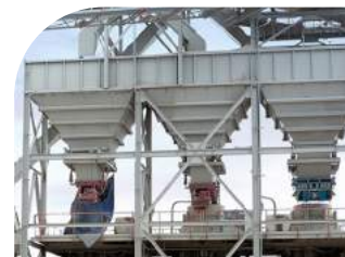
Britadores e moinhos