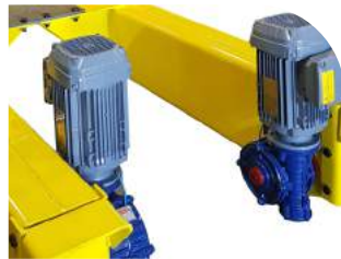
Redutores e Motores Elétricos