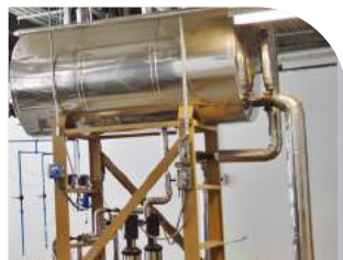
Geradores de calor