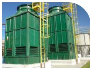
Torre de resfriamento de água